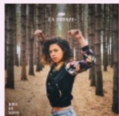
ROIS DE NOUS